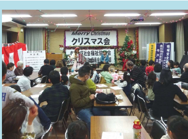
地域住民によるクリスマス会