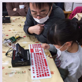
地域でプログラミング教室