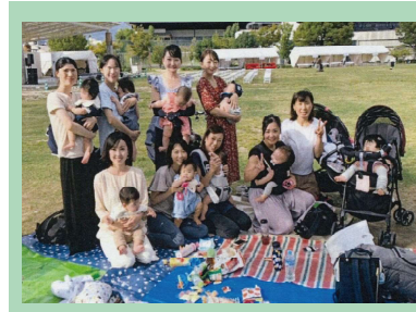
子育てサークルによる交流会