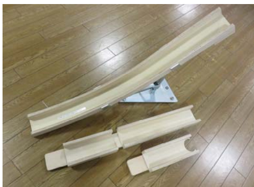
スタンダードランプ