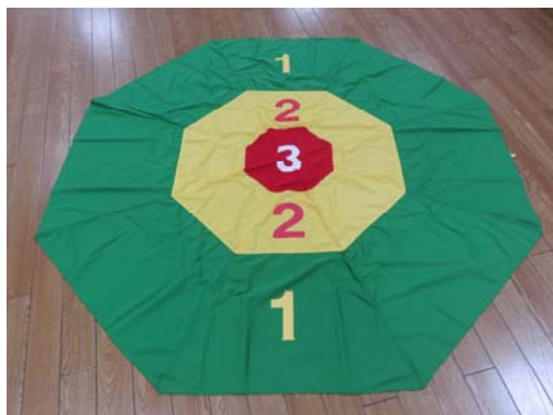
ボッチャ用八角的