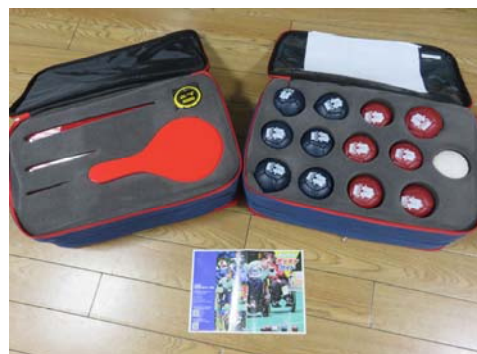
ボッチャボールセットCONNECT

ボッチャボールセットCONNECT 2セット スタンダードランプ 1台 ボッチャ用八角的 1つ